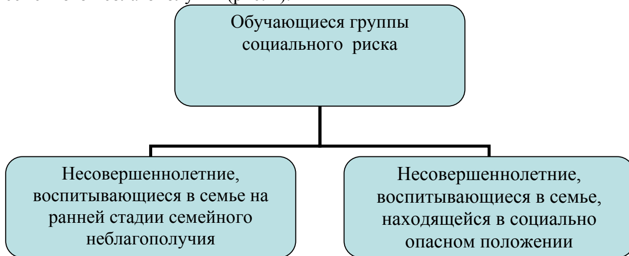
Рис. 2. Целевые группы риска несовершеннолетних в зависимости от показателей семейного неблагополучия

Система индивидуальных профилактических мероприятий внутришкольного учета в образовательной организации направлена на две целевые группы риска несовершеннолетних в зависимости от показателей семейного неблагополучия (рис. 2).