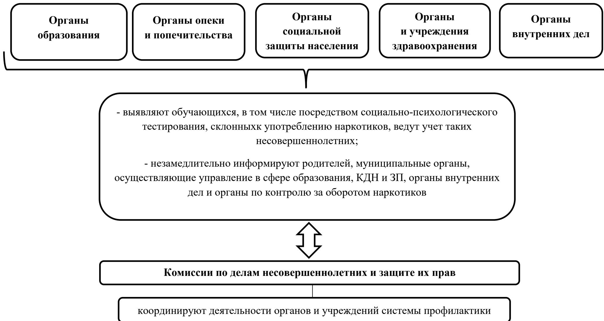
Схема 1. Выявление несовершеннолетних, употребляющих психоактивные и наркотические вещества, субъектами системы профилактики