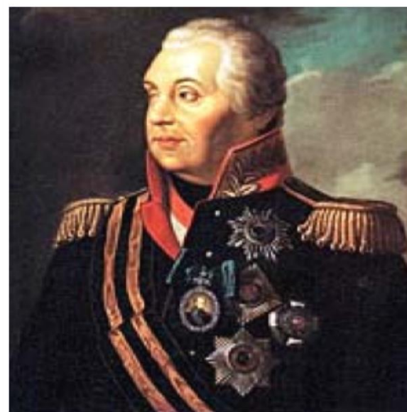
М. И. Кутузов. Художник Н. Яш. 1883.